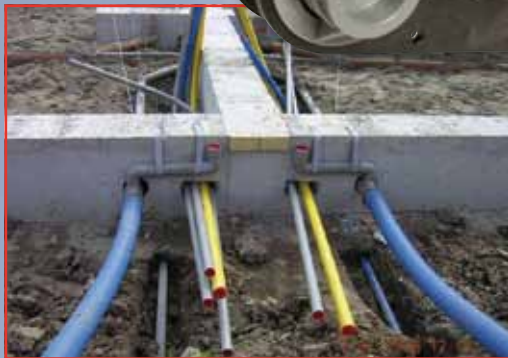
U geen afkeur!