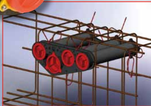
Wij de oplossing!