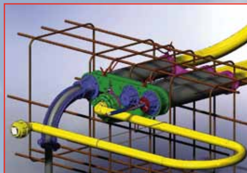
Oplossing zakkend gebied